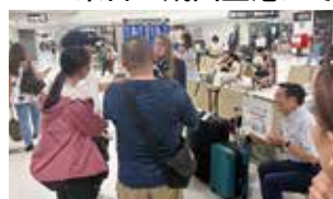
成田空港にて「YOUは何しに日本へ？」の取材を受ける