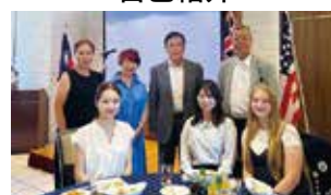
地区青少年交換歓迎会・ 帰朝報告会