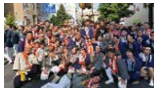
御神輿 藤友會の皆さんと