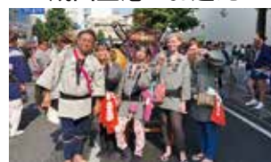
高崎まつり 柴崎ホストファミリーと